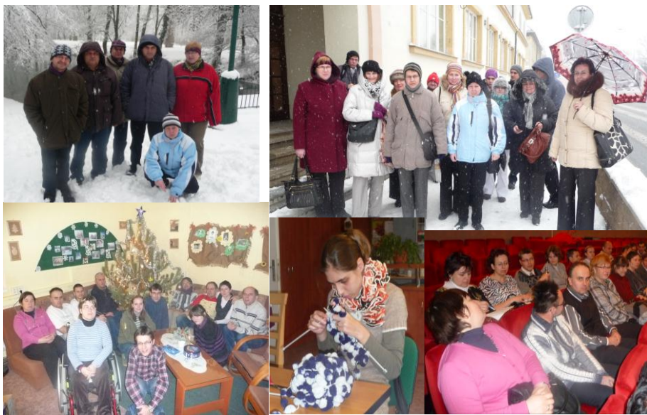
fotil kolektiv Kotvy