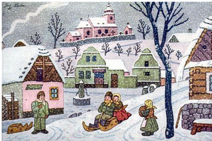
Kreslil Josef Lada