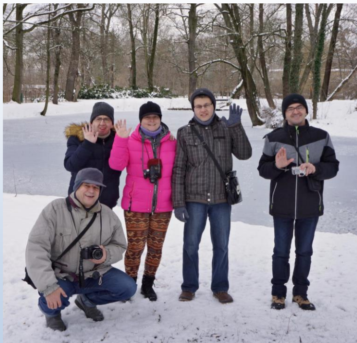
fotil kolektiv uživatelů

„Co se nedá prominout, musí se odpustit.“