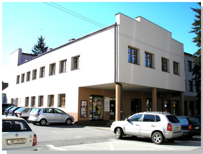
Budova, ve které je soustředěna hlavní činnost a sídlo Charity Strážnice Strážnice – ulice Kovářská 396

Charita Strážnice jako součást Arcidiecézní charity Olomouc (ACHO) patří k organizaci Charita Česká republika., která se v roce 1995 stala členem celosvětové organizace CARITAS INTERNATIONALIS.