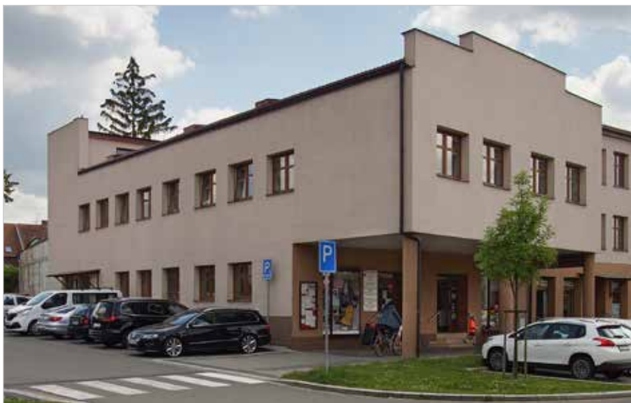
Budova, ve které je soustředěna hlavní činnost a sídlo Charity Strážnice Strážnice – ulice Kovářská 396

Charita Strážnice jako součást Arcidiecézní charity Olomouc (ACHO) patří k organizaci Charita Česká republika, která se v roce 1995 stala členem celosvětové organizace CARITAS INTERNATIONALIS.